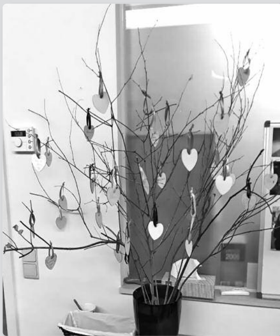
► Lors de la dernière rencontre à Cérroux...